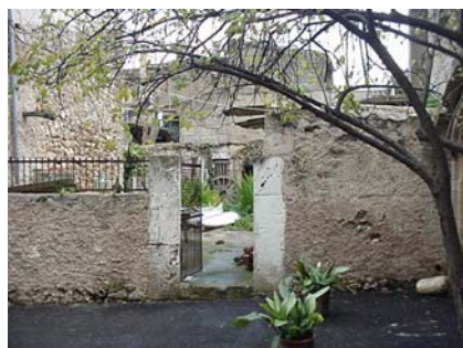
● CARRER PARES NÚMEROS 4 (09587-19), 8 (09587-21), 12 (09587-23), 28 (09587-31), 32 (09587-33), 38 (09587-36), 40 (08577-16), 48 (08577-20), 52 (08577-22), 60 (08577-26), 64 (08577-28), 66 (08577-29), 3b (09576-12), 3c (09576-11), 9 (09576-08), 27 (09563-30), 29 (09563-29), 31 (09563-28), 33 (09563-27), 35 (09563-26), 39 (09563-24), 43 (09563-22), 45 (09563-21), 47 (09563-20), 51 (09563-18), 53 (09563-17), 55 (08569-01), 65 (08569-05).