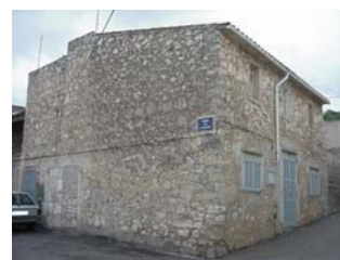
● CARRER NEBOT NÚMEROS 4 (09587-40), 6 (09587-39), 8 (09587-38), 10 (09587-37), 12 (09587-08), 14 (09587-07), 3 (09587-42), 5 (09587-43), 7 (09587-45), 13 (09587-48).