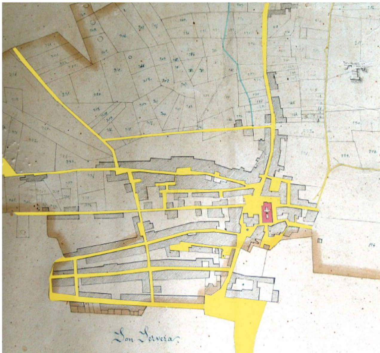
PLÀNOL PARCEL·LARI DIBUIXAT PER PERE DE ALCÀNTARA PENYA L'ANY 1859.