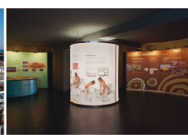
Besucherzentrum von s'Illo