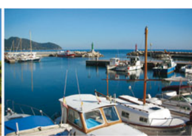
Cala Bona Hafen