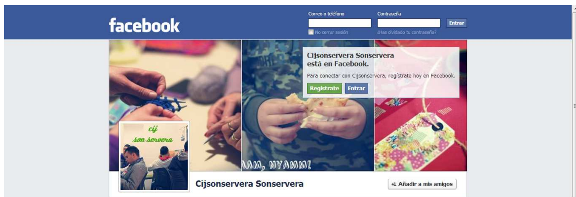
Imatge 2: Perfil de facebook del CIJ de Son Servera