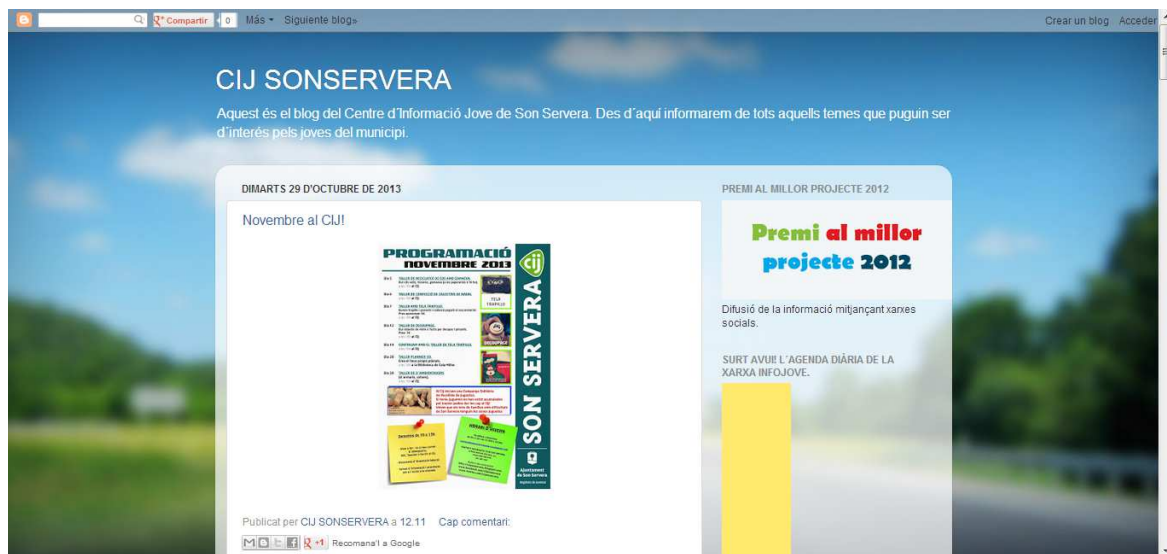
Imatge 1: Blog del CIJ de Son Servera